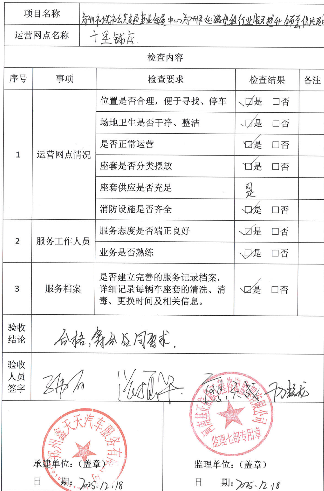
运营网点初验检查记录表